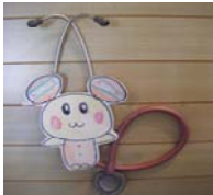
(①児に使用した聴診器)